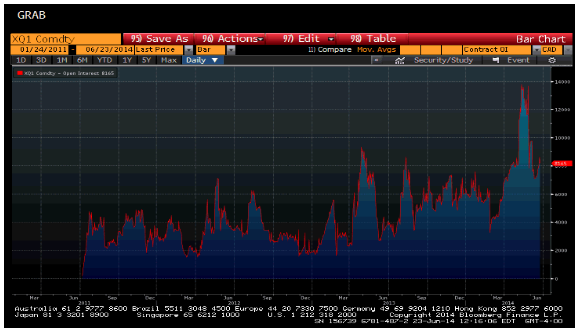
Figure 1 : Intérêt en cours du CGF de juin 2011 à juin 2014

Grâce au projet « Courbe de rendement », l'intérêt en cours du CGF a connu une croissance constante, passant de zéro (0) en juin 2011 à un sommet de près de 13 000 contrats en mai 2014. Cependant, depuis cette date, l'intérêt en cours du CGF a fléchi pour s'établir à environ 8 000 contrats, ce qui correspond au niveau de résistance historique pour ce contrat (voir la figure 1 ci-dessous).